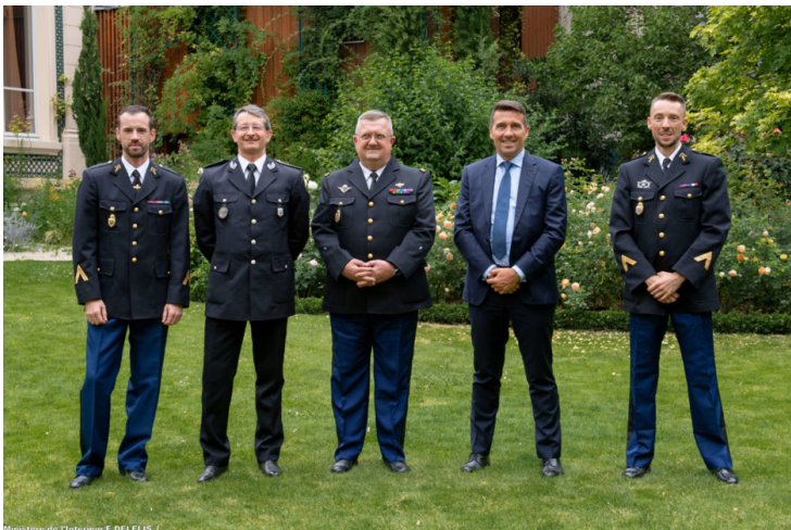
Le général Goudallier aux côtés du commissaire Dussel et du colonel Rénier à sa droite et des Gendarmes du CHEMI.

Apporté dans la corbeille de mariage par l'INHESJ dont il est l'un des fleurons, le département de l'int est dirigé par le lieutenant-colonel Christophe Torrissi depuis le 24 septembre 2019.