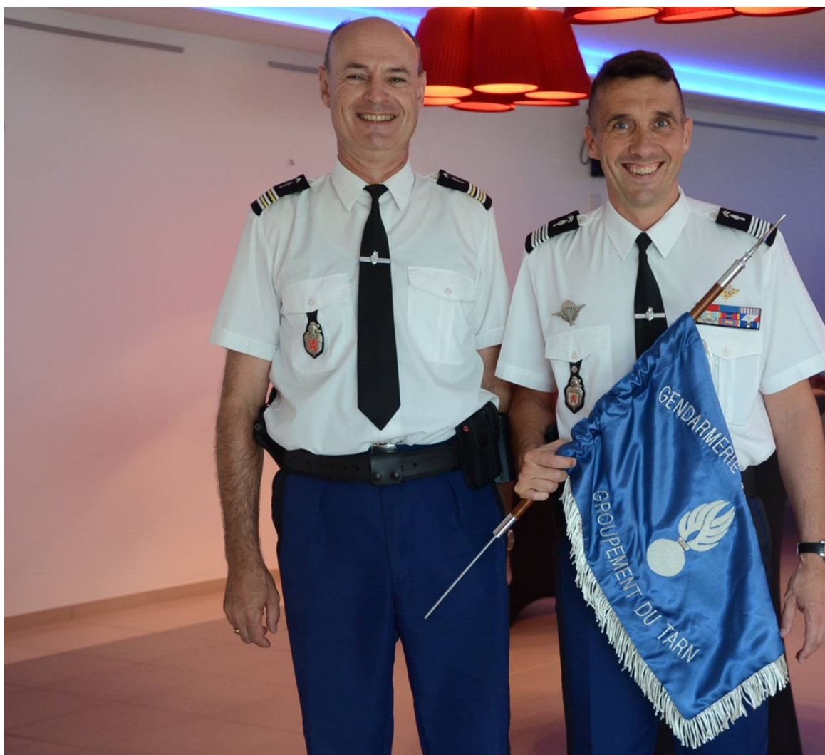
Le colonel Sylvain Rénier à droite lors de son départ du Tarn

C'est en effet un officier de Gendarmerie, le colonel Sylvain Renier , ancien commandant du groupement police à Marseille qui est à la tête de l'importante direction des affaires stratégiques et internationales et les départements de gestion de crise et de sécurité économique. Le colonel Renier qui était le directeur des relations extérieures du CHEMI depuis 3 ans, et vient d'être nommé à l'IGGN